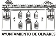
AYUNTAMIENTO DE OLIVARES